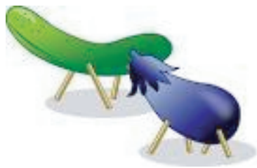
盆棚を飾る 仏壇の前に小机を置き位牌を出しなすやきゅうりの牛馬,花菓物を供える。

この日は,天正十八年(1590)に徳川家康が江戸城に入った日に当たります。これを記念して始まったのが,五穀豊穡・天下泰平を祈る奉納相撲で,幕府からは領民の体育を奨励するため水引幕が献納されました。