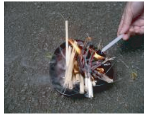
迎え火を焚く 13日の夕方祖霊が迷わず帰って来るように玄関先に目印として焚く