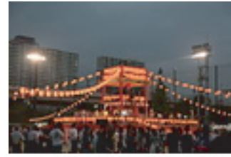
盆踊り 祖霊を迎えたことを喜び供養し彼岸に送るための風習 自分の災厄も祓う